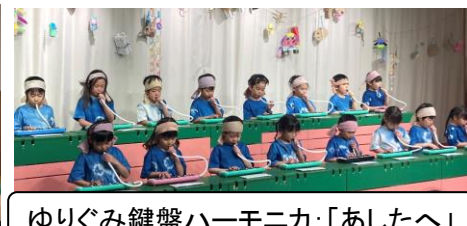
ゆりぐみ鍵盤ハーモニカ:「あしたへ」