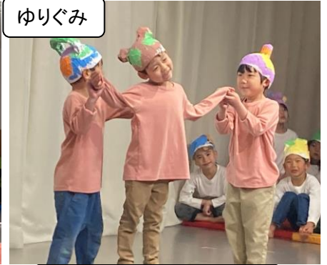
あそびの つくりえーたー