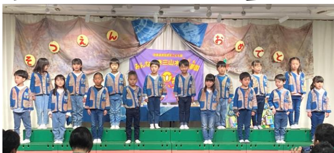
オリジナルの思い出を歌いました。いつまでもずっと応援しています。卒園おめでとう！