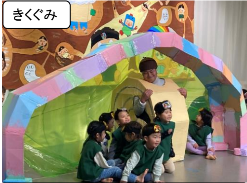
だんごちゃん つちのなのだいぼうけん