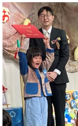
「ありがとう！」元気な 声で伝えていました。

たくさんの方に祝福され、第三回みんなのき三山木こども園の卒園式が執り行われ、16名のこどもたちが巣立っていきました。堂々と卒園証書を受け取る一人一人の姿に成長を感じました。保護者の方々が開催してくださった「ありがとうのつどい」では、素敵なスライドや歌、心温まるプレゼントをいただき職員一同感謝の気持ちでいっぱいです。ありがとうございました。