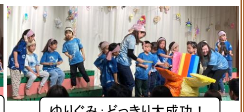
ゆりぐみ:どっきり大成功!