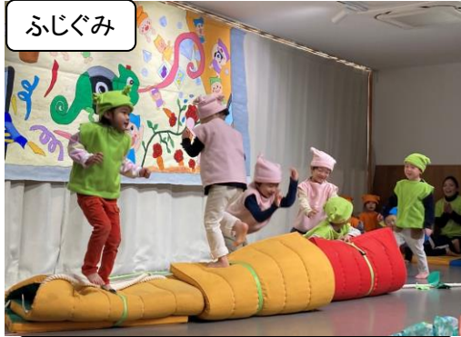
なびのすけの ふじふるえにえーたー